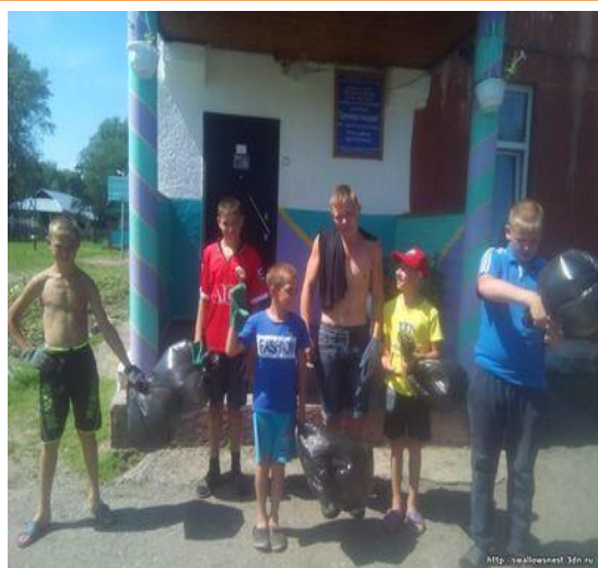
Экологическая акция «Чистый поселок»